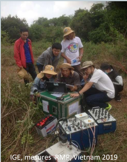
I GE, mesures RMP, Vietnam 2019

La cartographie du sol a connu d'importantes avancées depuis ses débuts il y a plus d'un siècle. La cartographie numérique des sols (DSM, Digital Soil Mapping), correspond à des techniques numériques qui visent à prédire des classes de sol ou des propriétés de sol. Elle utilise, d'une part, des données pédologiques et d'autre part, des données spatiales appelées covariables. On trouve parmi ces covariables des données issues de prospections géophysiques. Lors de GEOFCAN 2020, nous souhaitons pouvoir présenter des études récentes dans ce domaine.