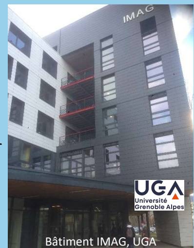
Bâtiment IMAG, UGA

Vendredi 07 novembre 2020 : date limite pour le paiement des inscriptions. ATTENTION nombre places limité à 100 : les premiers inscrits et ayant payés seront servis.