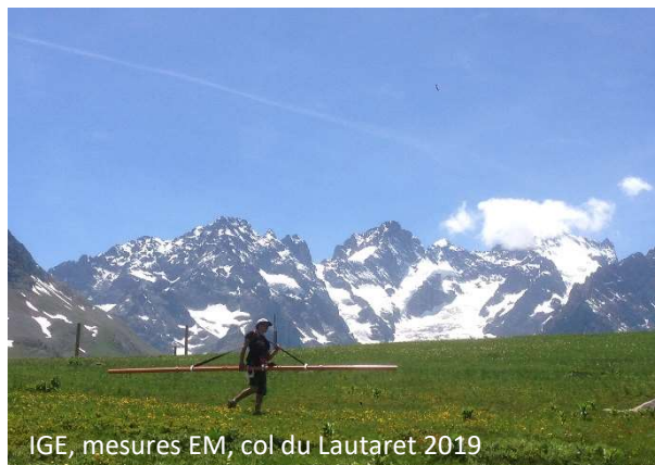
IGE, mesures EM, col du Lautaret 2019

GEOFCAN est un réseau de laboratoires de différents organismes de recherche et d'Universités, composé par le BRGM, l'INRA, l'INRAE, l'IRD, Sorbonne Université et l'Université Paris Sud-Orsay. Son objectif est de rassembler des compétences techniques et des connaissances pratiques et théoriques dans le domaine de la géophysique de sub-surface appliquée aux formations superficielles.